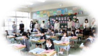
この教室で勉強します