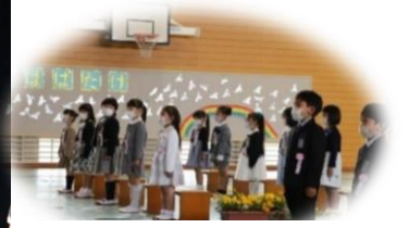
丁寧な礼ができました