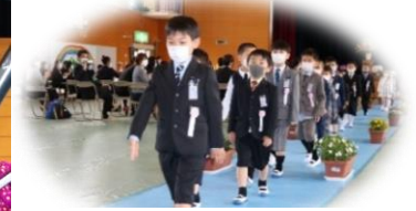
緊張の式を終えて