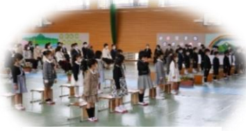
背筋を伸ばして起立